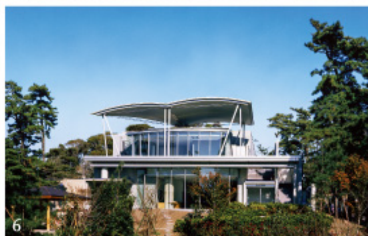
1 下瀬美術館 (設計:坂 茂) 2 鳥根県芸術文化センター (設計:内藤 廣) 3 豊島美術館 (設計:西沢 立衛) 4 犬島精錬所美術館 (設計:三分一 博志) 5 神奈川県立近代美術館 (設計:坂倉 準三) 6 茅ヶ崎市美術館 (設計:山口 洋一郎)