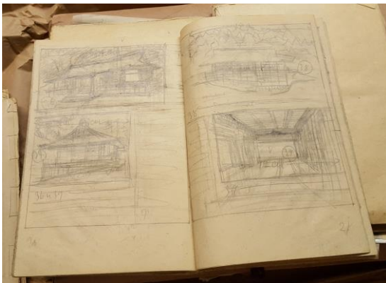
“ Japanische Architecture ” のレイアウト見本