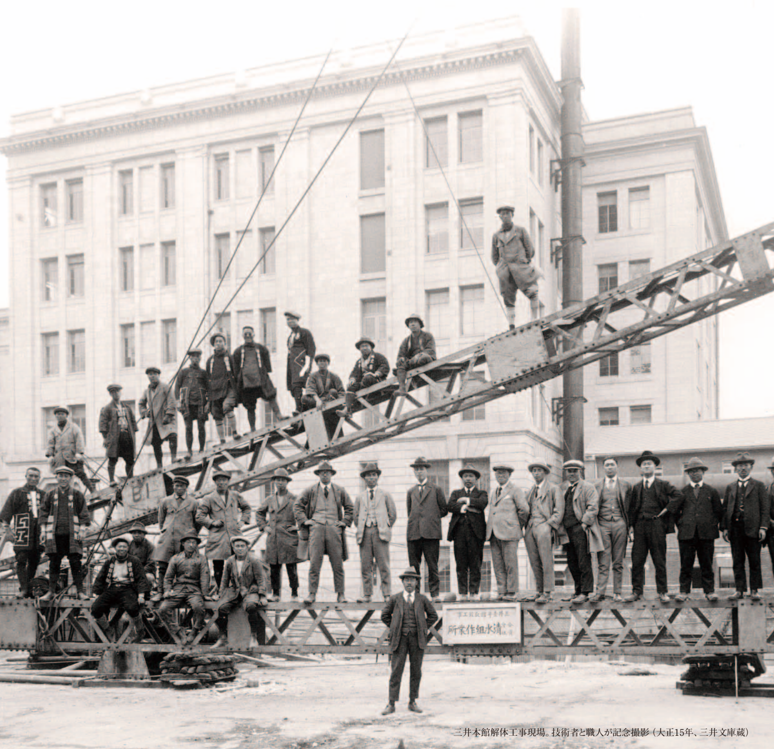
三井本館解体工事現場。技術者と職人が記念撮影（大正15年）